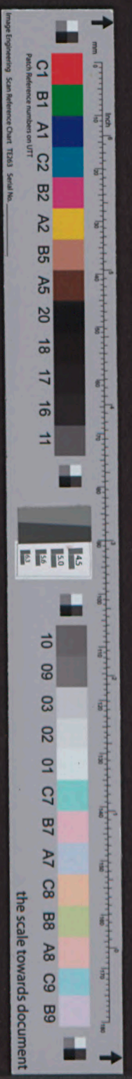
Image Engineering Scan Reference Chart IT283 Serial No.