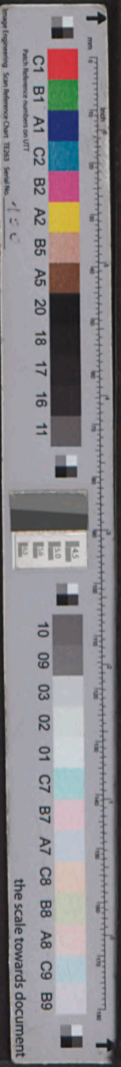
Image Engineering Scan Reference Chart TCR3 Serial No. 150 the scale towards document