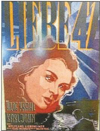
Schwerer Anfang: „Liebe 47“ war im Kino noch kein Erfolg.

Eröffnung: Donnerstag, 9. Juni, 16.30 Uhr im Stadtarchiv (Nebengebäude des Neuen Rathauses). Bis 30. Dezember. Geöffnet: Montag bis Mittwoch 8 bis 15.30 Uhr, Donnerstag 8 bis 18 Uhr, Freitag 8 bis 13 Uhr. Der Eintritt ist frei.